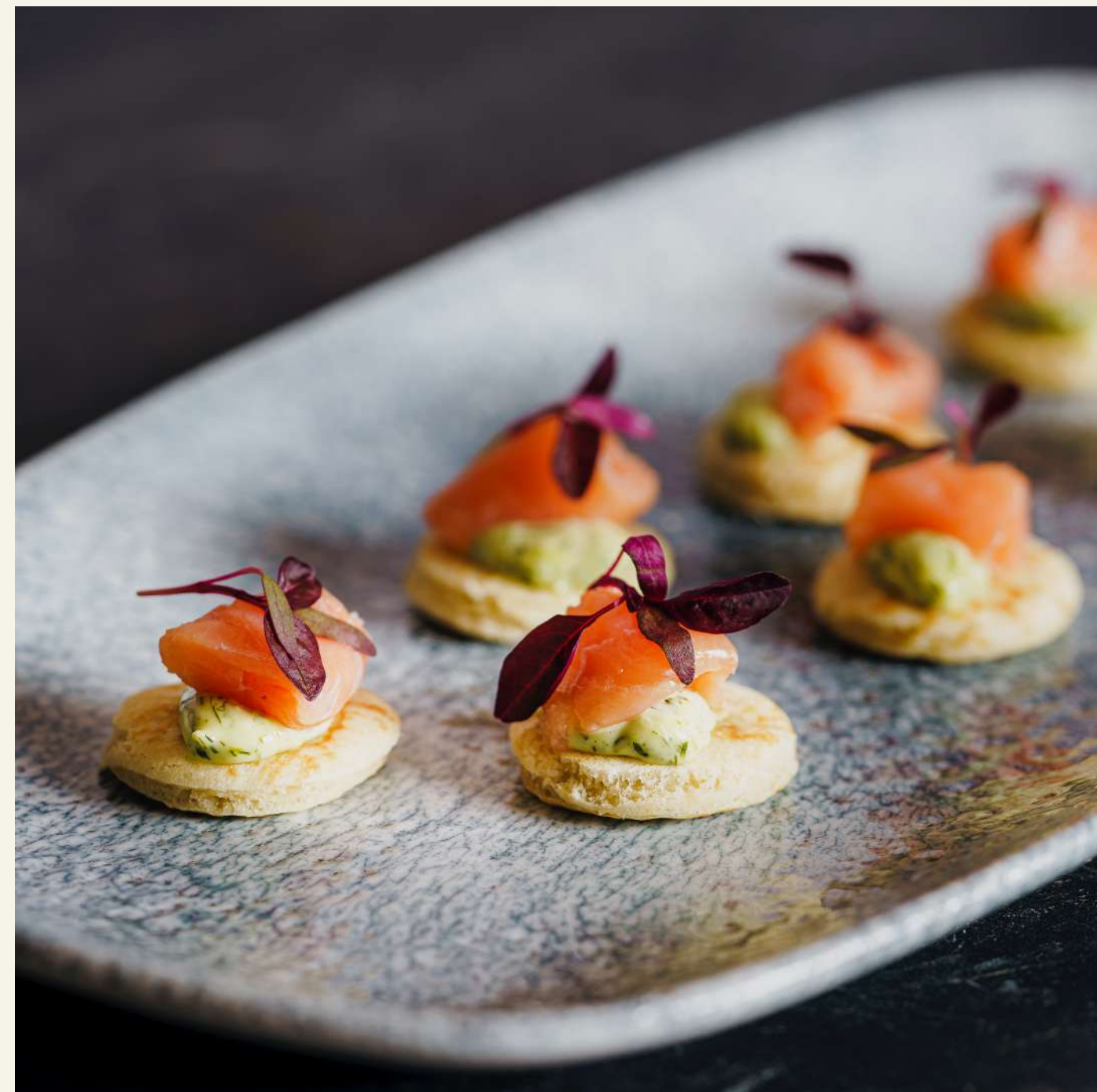
Amuses-bouche en apéritif